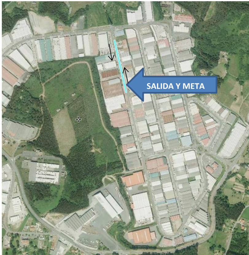
RECORRIDO Prebenjamín y pitufos 100 m aprox.