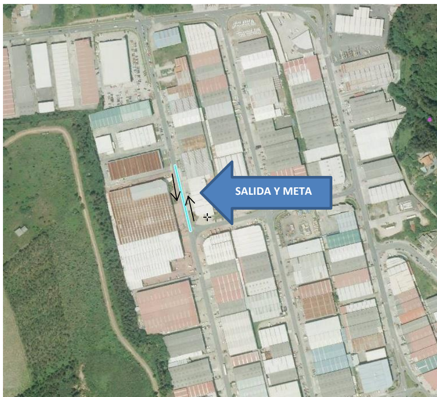
RECORRIDO ANDAINA: 6 km aprox.